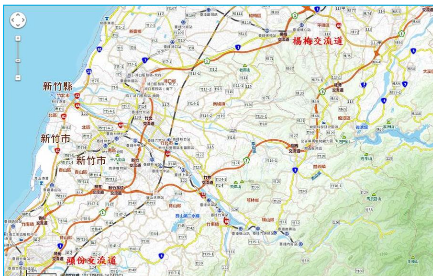
國道 1 號五股至楊梅段拓寬工程延伸至新竹、頭份計畫路廊示意圖

本案目前辦理可行性研究, 除將擬議中前瞻基礎建設之相關軌道計畫納入考量, 並針對開發可能面臨之地質敏感區、新竹交流道區緊臨建物、既有道路及交流道布設困難等重要課題研擬可行對策, 做為後續規劃、設計作業之依據, 預計 108 年底前完成研究成果初稿。