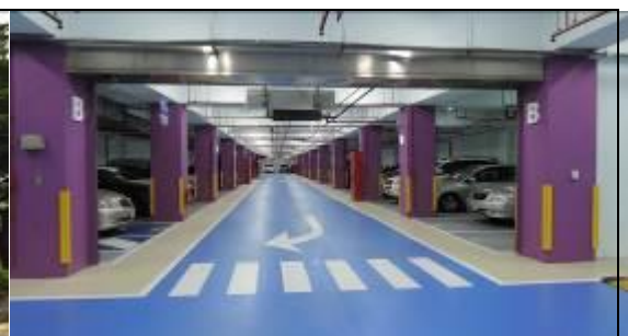
圖 8 八德區大忠國小地下停車場(活化)