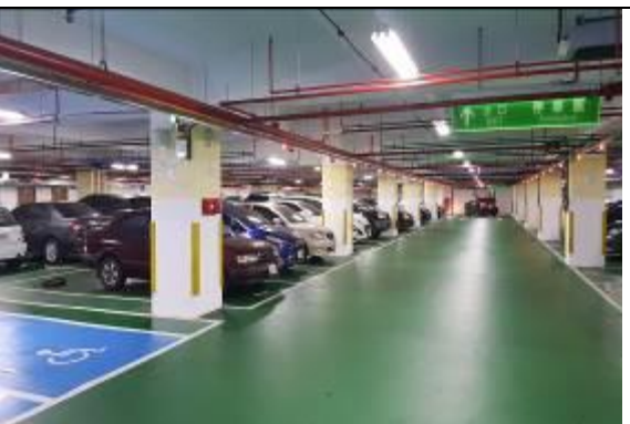
圖 7 中壢區銀河廣場地下停車場(活化)