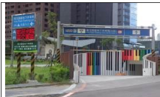
圖 1 桃園區藝文園區(南區)地下停車場