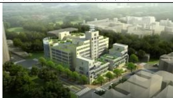
圖 4 中壢區自強停車場興建工程