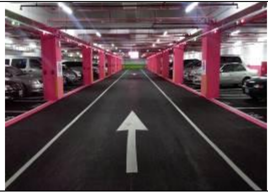
圖 5 桃園區西門國小地下停車場(活化)