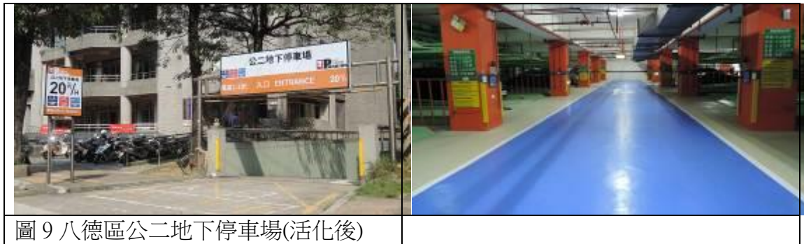
圖 9 八德區公二地下停車場(活化後)