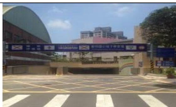
圖 2 新明國民小學地下停車場