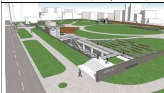
圖 3 桃園區公 24 地下停車場興建工程