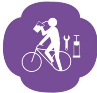
自行車休息站 Cyclist Rest Stop