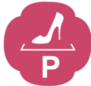
女士優先停車區 Reserved Parking for Women